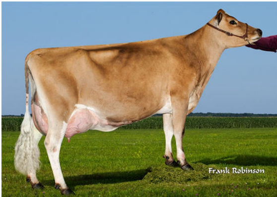
AHLEM SKYLER SKITTLES 56480-P