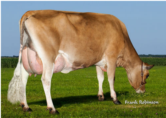
AHLEM SKYLER SKITTLES 56480-P